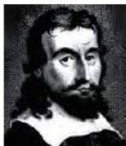
Joseph Alleine (1634-1668)

“Ó vós, todos os que tendes sede vinde às águas, e os que não tendes dinheiro, vinde, comprai e comei; sim, vinde e comprai sem dinheiro e sem preço, vinho e leite. Por que gastais o dinheiro naquilo que não é pão? E o produto do vosso trabalho naquilo que não pode satisfazer? Ouvi-me atentamente, e comei o que é bom, e a vossa alma se deleite com a gordura. Inclinaí os vossos ouvidos, e vinde a mim; ouvi, e a vossa alma viverá; porque convosco farei um concerto perpétuo, dando-vos as firmes beneficências de Davi” (Is 55.1-3).